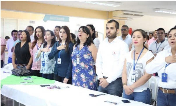
Figura 2. Jornadas de Rendición de Cuentas por la Rectoría y la Alta Dirección.