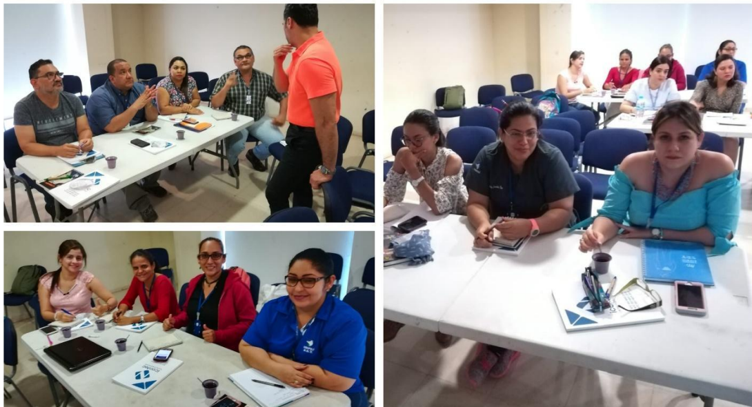
Figura 1. Formación en Diplomado en Sistemas de Gestión de la Calidad NTC ISO 9001:2015