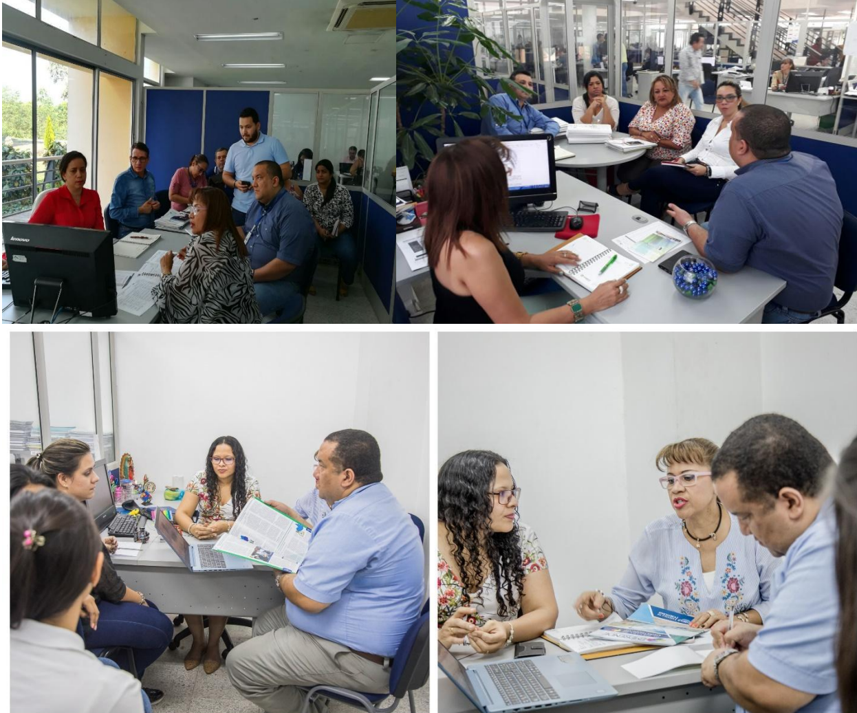
Figura 3. Ciclo de Auditorías Internas

Decreto Ordenanza 0331 de 1987 Gobernación de Santander Vigilada Mineducación NIT 800.024.581-3