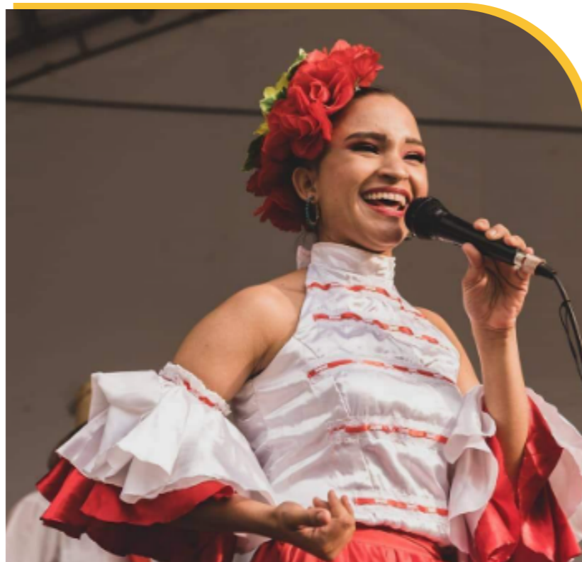
Fotografía: Bogotá D.C, Feria de ANATO

Actualmente, se dedica a interpretar música folclórica colombiana, especialmente la música ribereña tradicional (Cumbias, porros, fandangos, mapalé, garabato y sones de tambora)