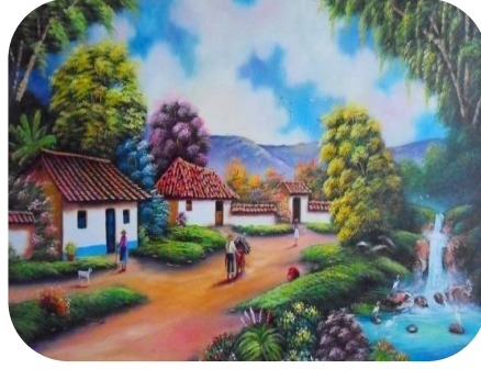
Nota: Paisajes colombianos (2012), Gabriel Nieto.