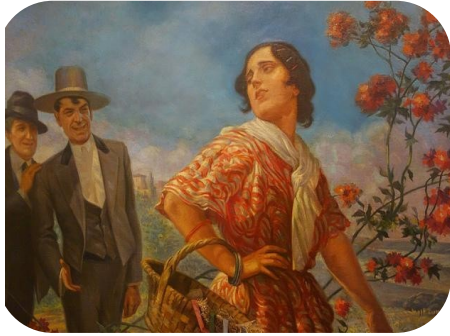
Nota: El cumplido (1924), Coriolano Leudo.