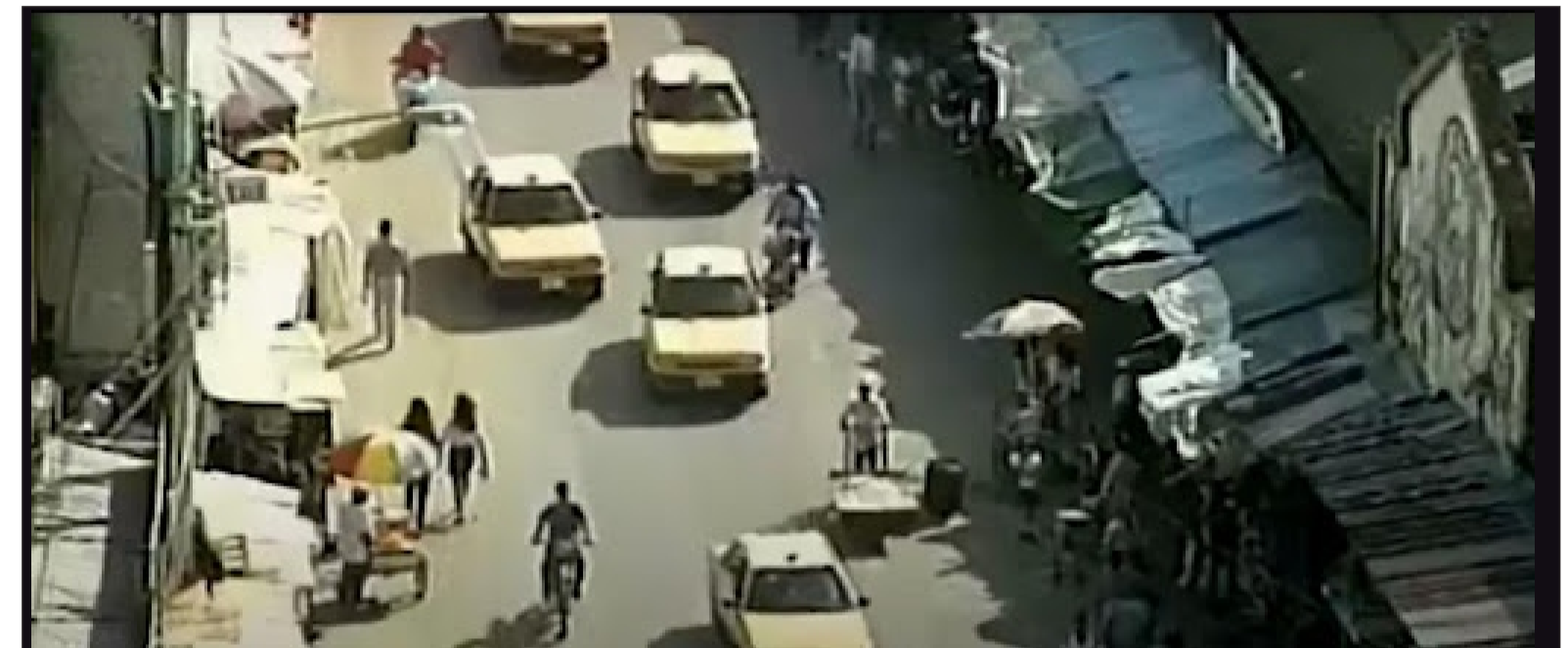
Las calles a la entrada del corregimiento Llanito el día 28 de febrero de 1999 horas antes de la masacre

Era un estudiante que se encontraba en su hogar culminando sus respectivos deberes para poder irse a la cancha a jugar, “quisieron ser como las 4:30p.m. y él me dijo: mami, yo me iré a jugar