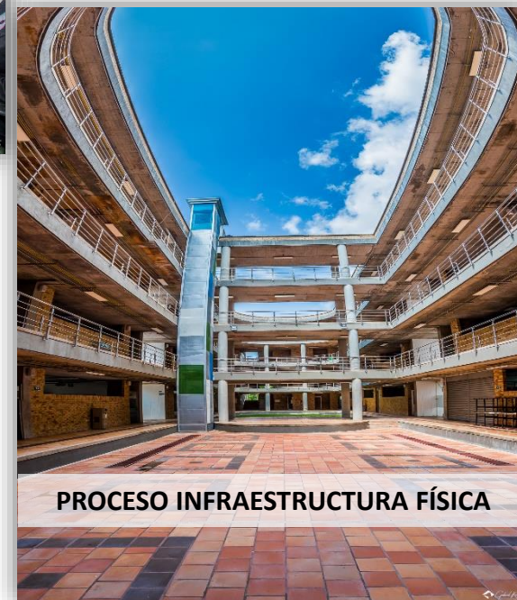
PROCESO INFRAESTRUCTURA FÍSICA