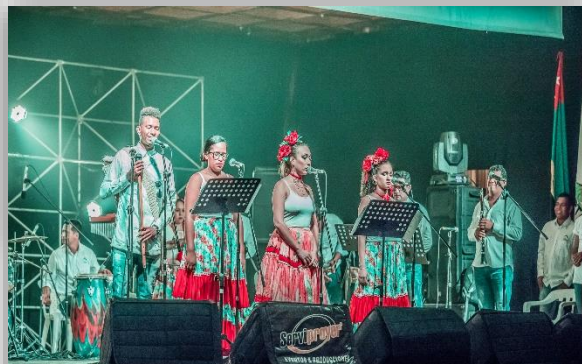
PROCESO BIENESTAR UNIVERSITARIO