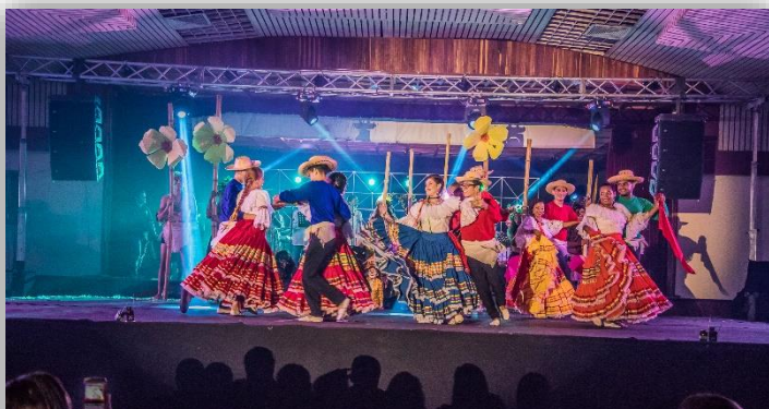
PROCESO DE FORMACIÓN