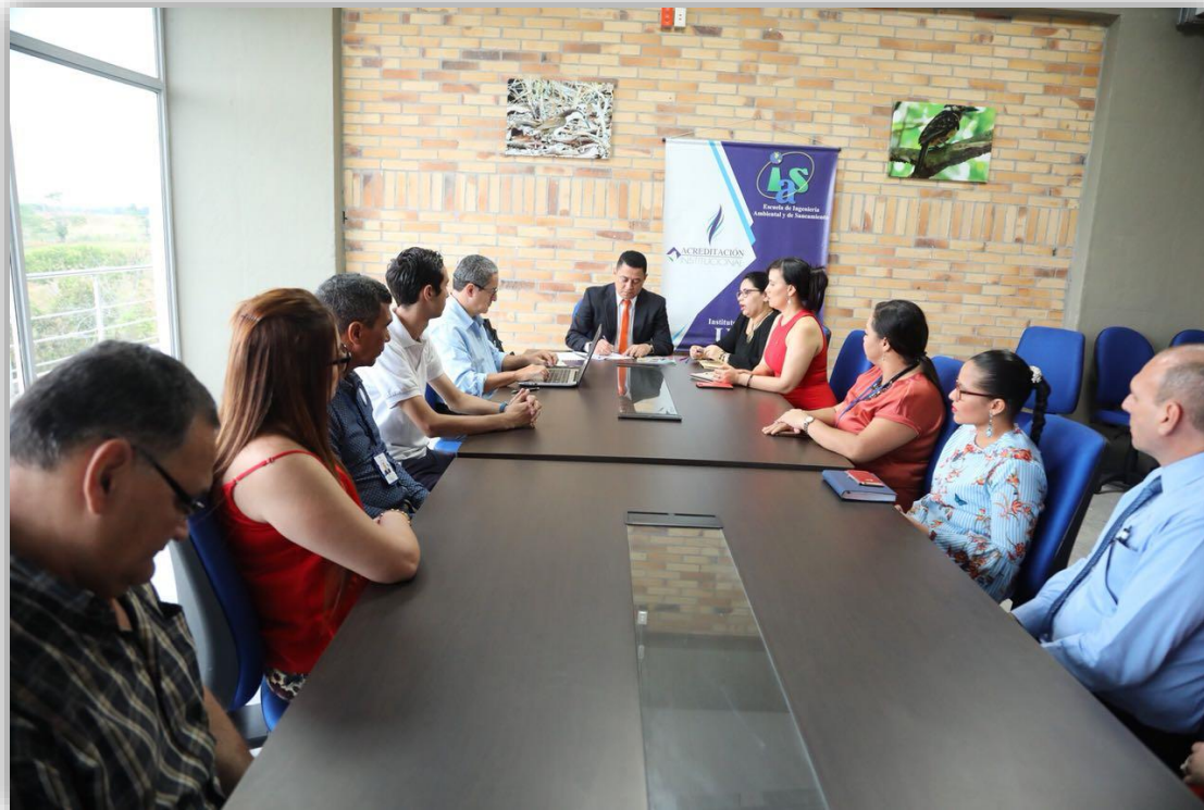
Ingeniería Ambiental y de Saneamiento