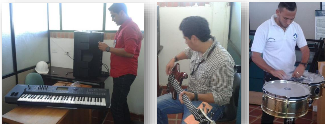
Figura 8. Instrumentos musicales.

1.2.7 Celebración de los 26 años de UNIPAZ. Comprometidos con el desarrollo de la Educación Superior para contribuir a la calidad educativa y promoviendo el desarrollo de docentes y estudiantes mediante el intercambio de experiencias educativas, en el marco de sus 26 años, UNIPAZ organiza una semana técnica, la cual incluye actividades académicas de gran relevancia.