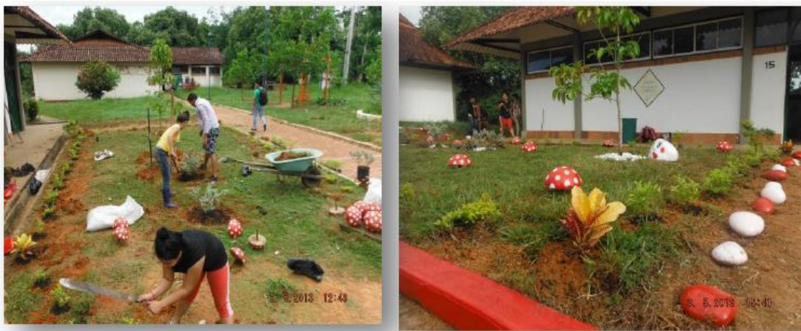
Figura 14. Embellecimiento y ornato del Centro de Investigaciones Santa Lucia.

1.4.7 Proyectos de construcción. UNIPAZ continua invirtiendo en el mejoramiento de las instalaciones, en el 2013 se inició con el mantenimiento y mejoramiento del nucleo de produccion piscicola, con este trabajo se ha buscado reactivas el lago principal , las piscinas y un galpon donde los mas befciciados sin lugar a duda son los estudiantes, quienes afianzan sus conocimientos en la practica.