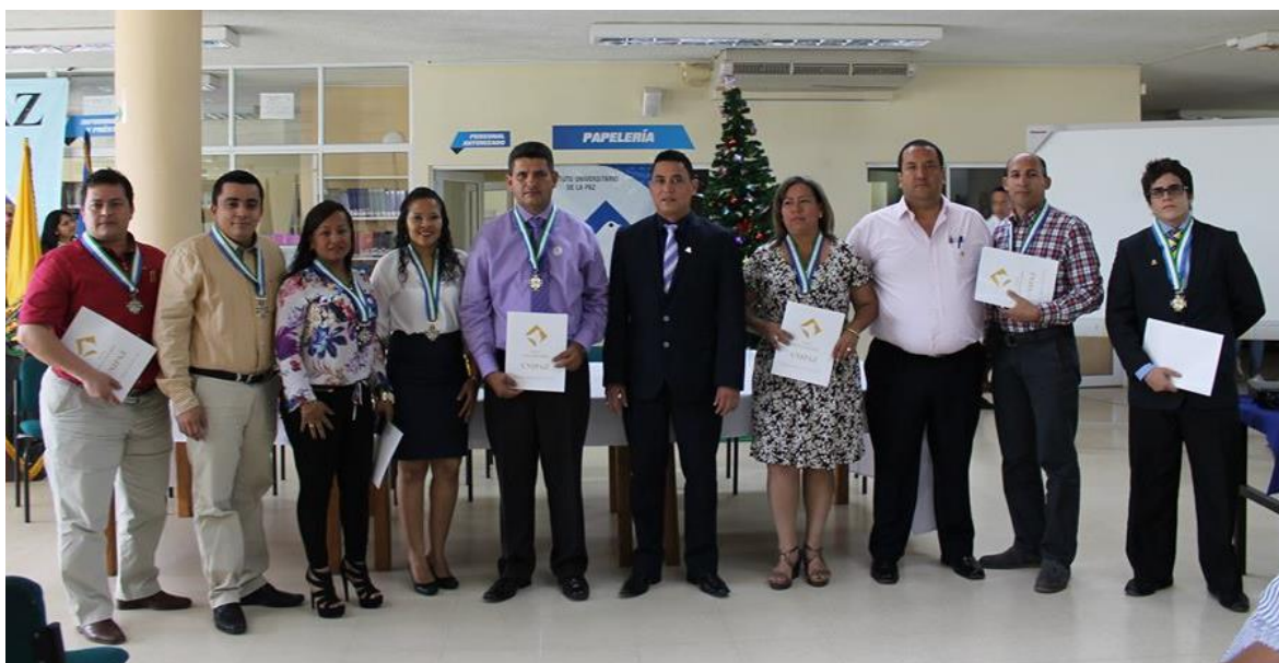
Figura 5. Encuentro de Egresados.

Las directivas manifestaron la importancia de realizar este evento el cual busca mediante estos escenarios incrementar el sentido de pertenencia con la institución, además de conocer el impacto de los programas y la situación de los profesionales de UNIPAZ en el mundo laboral.