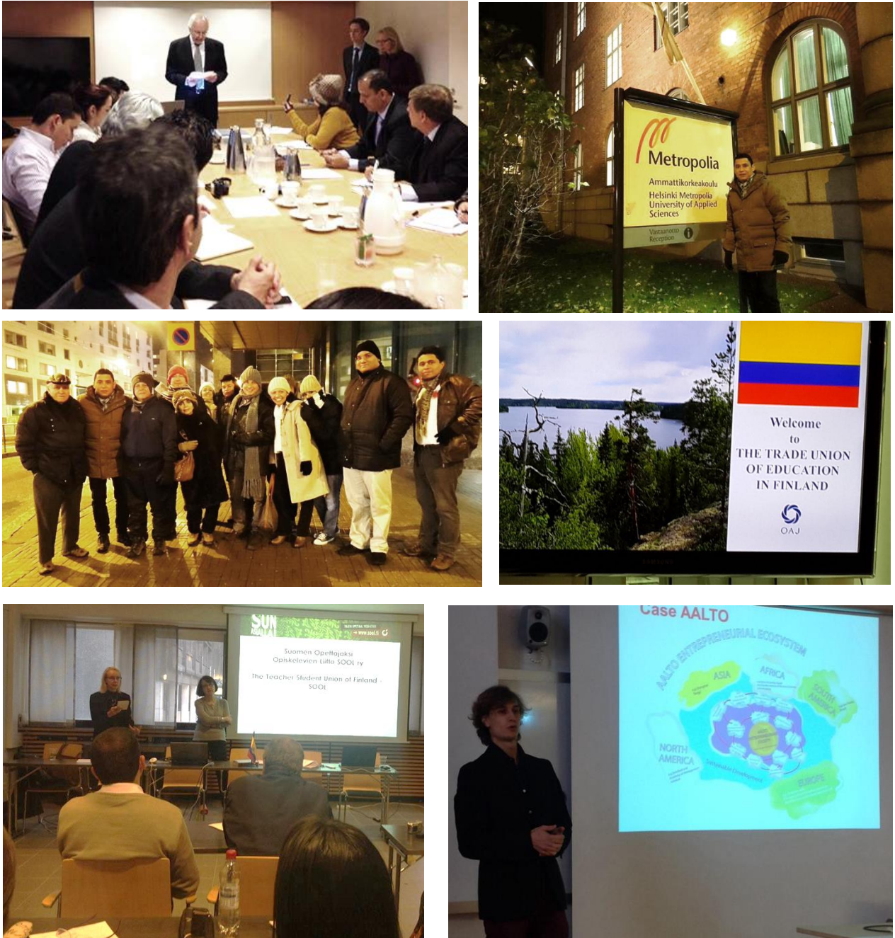
Figura 4. Misión Técnica Exploratoria – Finlandia, Helsinki.