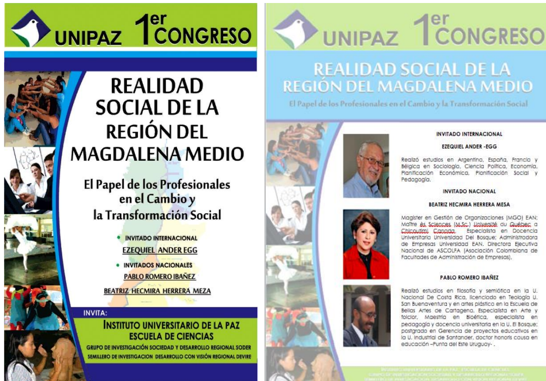
Figura 2. Promoción 1er Congreso de la realidad social de la región del Magdalena medio.