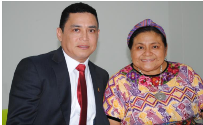
Figura 11. Conferencistas Invitados “Encuentro: la Paz, es nuestro compromiso”

Para UNIPAZ en memoria de sus 26 años de vida. La Paz es Vida Rigoberta Menchú