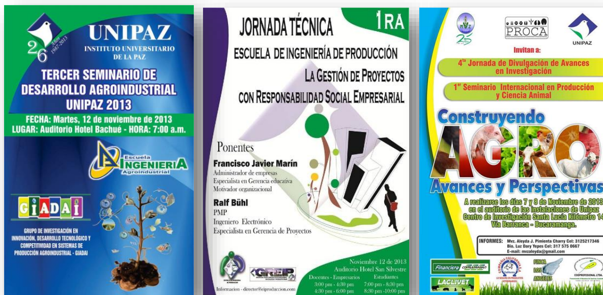
Figura 13. Promocionales.

Además se encuentran otros eventos con la participación de ponentes de reconocida trayectoria nacional e internacional.