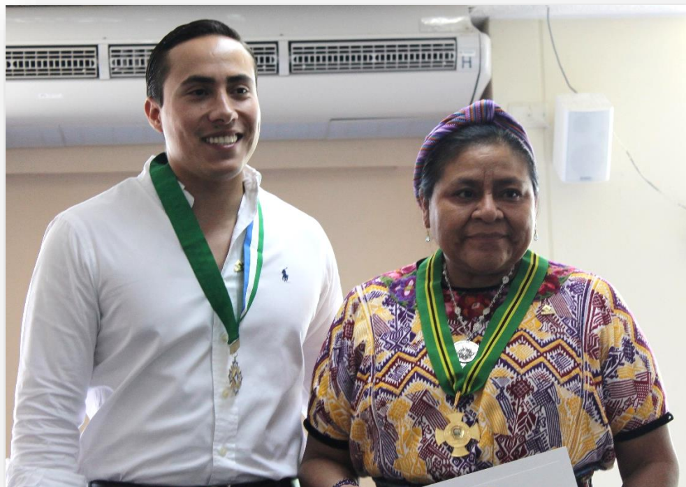
Figura 10. Entrega de reconocimientos por parte del Gobernador de Santander a la Dra. Rigoberta Menchu Tum

Además con gran éxito se desarrolló el evento para construir Convivencia y Paz en la región del Magdalena Medio denominado “Encuentro: la Paz, es nuestro compromiso”. Iniciativa liderada por UNIPAZ que convocó a generar alianzas entre entidades locales, regionales, nacionales e internacionales, para unir, integrar y conformar equipo para afirmar el compromiso de la participación en el restablecimiento del tejido social hacia la transformación del sujeto como ciudadano y actor participante activo en el desarrollo del Proceso de Paz y el acercamiento al posconflicto.