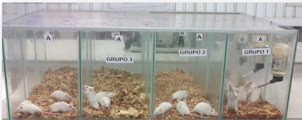
Figura 1. Trabajo de Investigación.