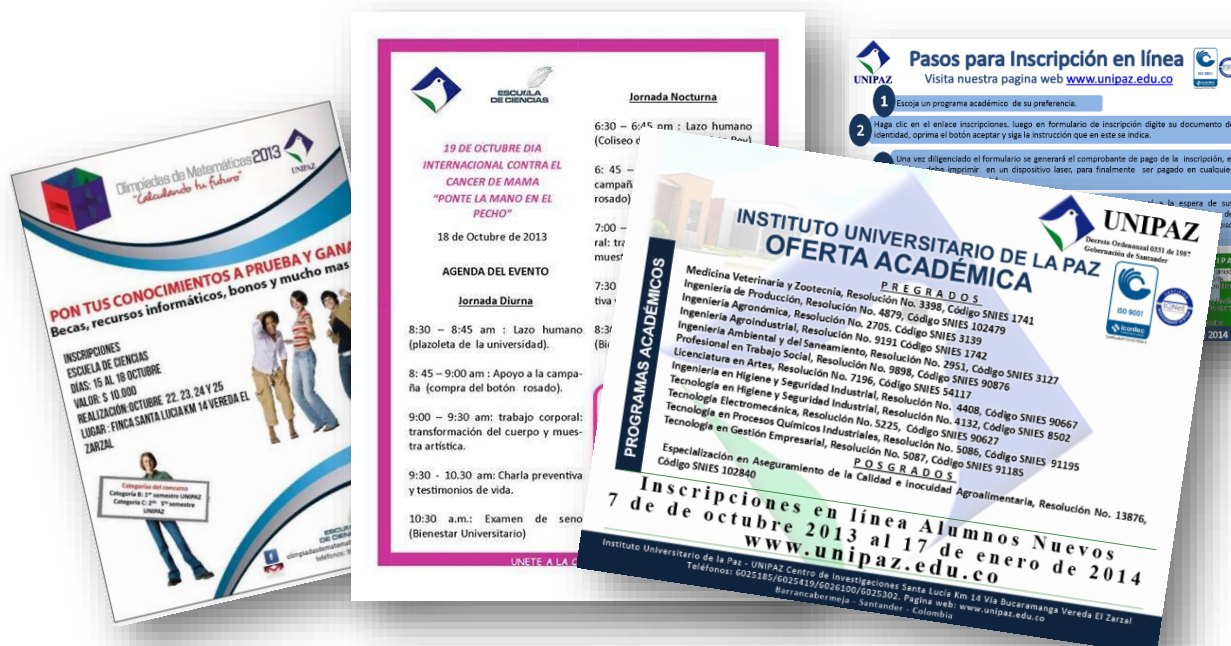
Figura 7. Promoción Institucional

1.2.6 Formulación e implementación de proyectos para el fortalecimiento de las actividades de Bienestar Universitario. Se destaca la compra de uniformes, implementación deportiva y atuendos de baile y camisetas para los grupos musicales en desarrollo del proyecto de formación integral a través de actividades lúdicas y deportivas en la comunidad educativa, donde la inversión fue de $39.666.314.00. Así mismo la compra de instrumentos musicales y sonido en desarrollo, con una inversión de $53.200.000.00.