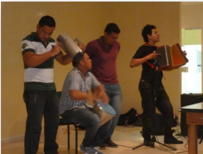
Figura 6. Grupos culturales.

1.2.3 Área de cultura y comunicación. En el área cultural se logró el fomento, la organización y difusión de las actividades culturales de UNIPAZ en todas sus expresiones. Este año se han desarrollado 68 presentaciones escénicas, donde los grupos los integran estudiantes, profesores, egresados, empleados y administrativos los cuales representan Danzas, Vallenato, Grupo Cairos, Bohemia, Línea de Fuego, Mariachi, Reggaetón, y Unitropico, logrado proyectar el potencial artístico y cultural del alma máter, generando actividades, eventos, servicios, entre otros.