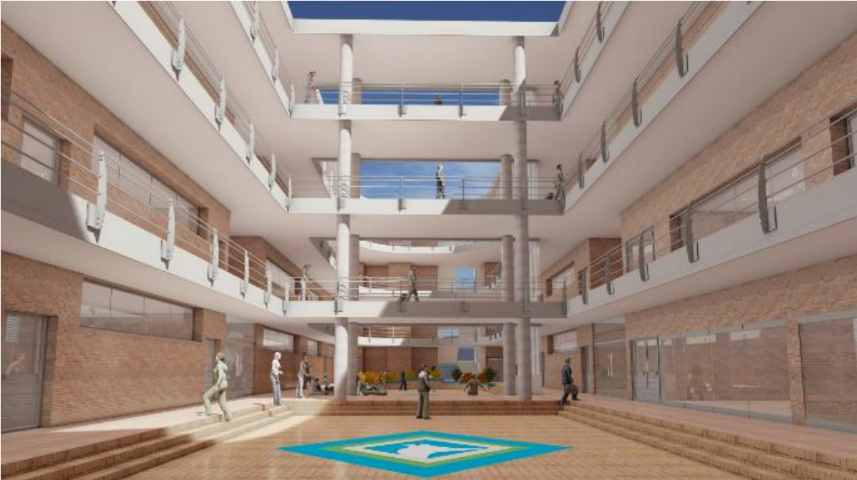
Figura 15. Imagen del edificio de aulas terminado según diseño.