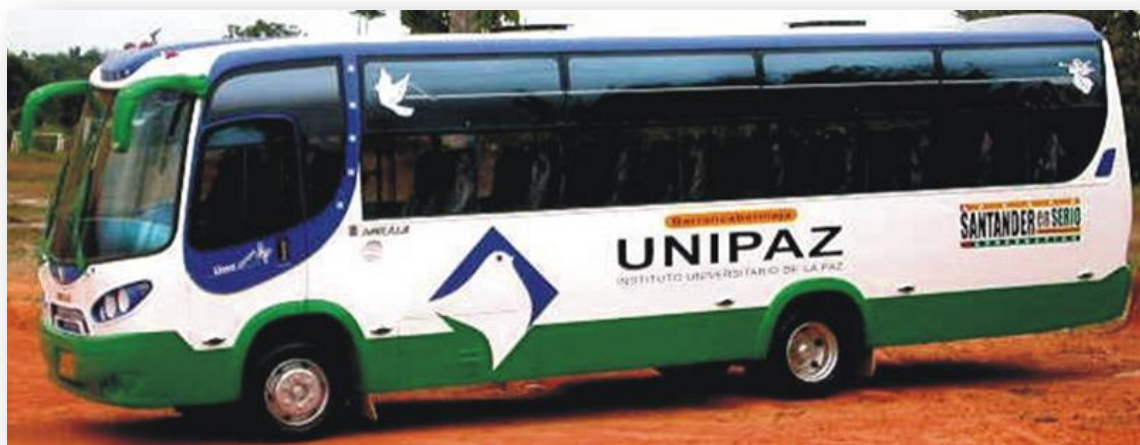
Figura 38. Bus de UNIPAZ.

1.4.5 Disponibilidad del bus de UNIPAZ. Ya está en condiciones para prestar el Servicio a la Comunidad Universitaria el Bus de la UNIPAZ, el cual cuenta con todos los permisos pertinentes para ser utilizado.