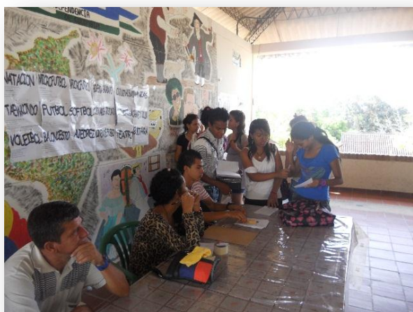
Figura 19. Expo bienestar.