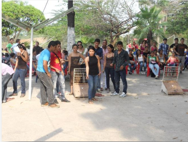
Figura 20. Torneo interescuelas de minitejo.

d. Campeonato interescuelas de futbol. En este campeonato se inscribieron 12 equipos de los diferentes programas académicos, con 113 participantes.