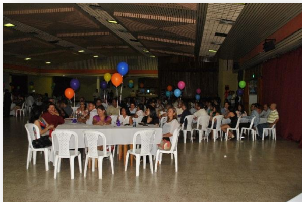
Figura 33. Día del docente.

hizo entrega de reconocimientos, rifas y una cena para finalizar la velada. Asistieron Rector, Vicerrector, 150 docentes y 23 funcionarios Administrativos.