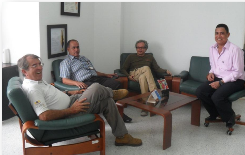
Figura 4. Visita del Presidente de la red Nacional de Jardines Botánicos.

1.1.4.2 Convenios Interinstitucionales. UNIPAZ desarrollo alianzas estratégicas a través de convenios interinstitucionales de cooperación con entidades de la región del Magdalena Medio y el país como;