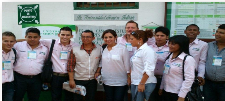
Figura 1. Participantes en el IX Encuentro Departamental de Semilleros de Investigación.

Además UNIPAZ participó durante todo el evento con sus docentes seleccionados como pares evaluadores, cumpliendo con la programación establecida. Después de la Universidad Simón Bolívar, anfitriona, UNIPAZ aportó el mayor número de pares evaluadores al evento (12). Los resultados fueron positivos 24 proyectos fueron aprobados y 14 de estos pasaron al Encuentro Nacional de Semilleros de Investigación, evento que se realizará en los próximos meses en la ciudad de Montería.