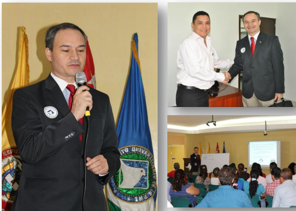
Figura 10. Conversatorio con el honorable cónsul de Brasil.

Producto de esta gestión, en la actualidad hay seis estudiantes haciendo gestión para movilidad académica hacia universidades de Brasil, se ha propuesto realizar una serie de actividades entre UNIPAZ y el consulado que contemplan: Curso de lengua portuguesa, semana brasilera en UNIPAZ, recibimiento de una misión académica proveniente de la Universidad Estatal de Campinas. Y la gestión de una misión académica de UNIPAZ para traslado a Brasil y establecer alianzas estratégicas para fortalecer la docencia, la investigación y proyección social con universidades de Brasil.