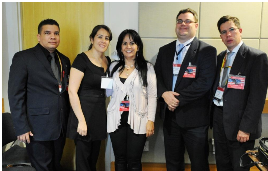
Figura 13. Participación de UNIPAZ en el evento Building Bridges to Educational Exchange.

Luego de la participación en tan importante evento, se pudo llegar a establecer vínculos con universidades colombianas, que ya han iniciado con éxito el proceso de internacionalización, y la movilidad educacional.