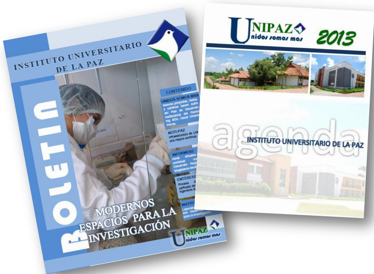
Figura 34. Campaña publicitaria Institucional.

1.2.5 Fortalecimiento de la Imagen Institucional. En la página web de UNIPAZ se publicaron permanentemente boletines informativos, noticias y eventos, así mismo se desarrollaron estrategias de comunicación con el apoyo de métodos actualizados para el manejo de la información que permitieron la planeación, el diseño y el desarrollo de campañas publicitarias plasmadas en volantes, afiches, pendones, videos institucionales, entre otros.