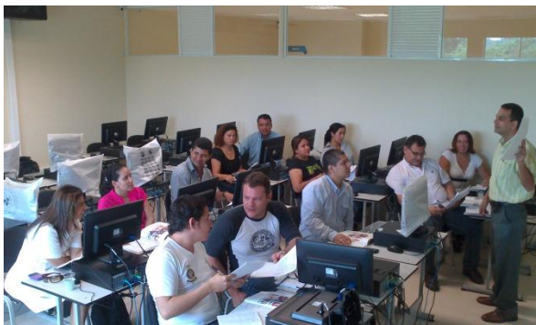
Figura 14. Programa piloto de bilingüismo institucional.

Además de ello, la Escuela de Ingeniería Agroindustrial, dio inicio al proceso de creación del Partners Campus, para lograr hermanamiento con otros Campus en Colombia y el continente, donde Partners of the Americas ha logrado establecerse como una fuerte institución de apoyo a procesos de internacionalización, voluntariado y liderazgo en las Américas.