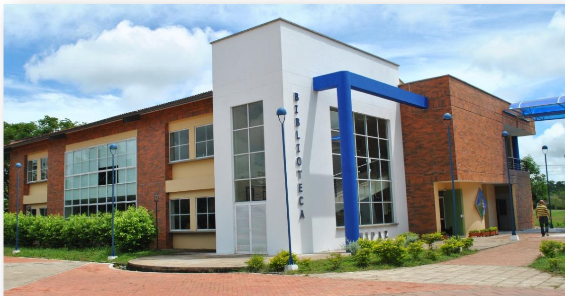
Figura 36. Instituto Universitario de la Paz..