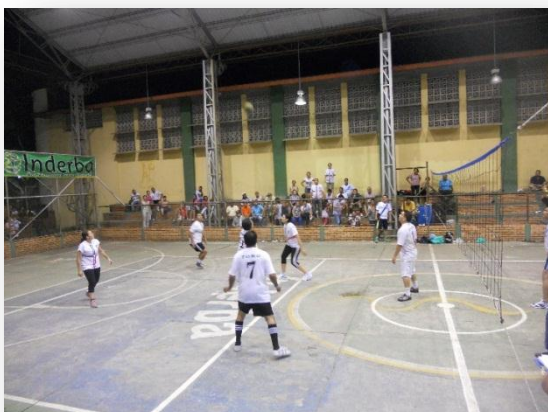
Figura 23. Campeonato de voleibol mixto Docentes y Administrativos.

f. Campeonato de voleibol mixto Docentes y Administrativos. Se inscribieron 8 equipos de acuerdo a las preferencias de Docentes y Administrativos, con un total de 89 participantes.