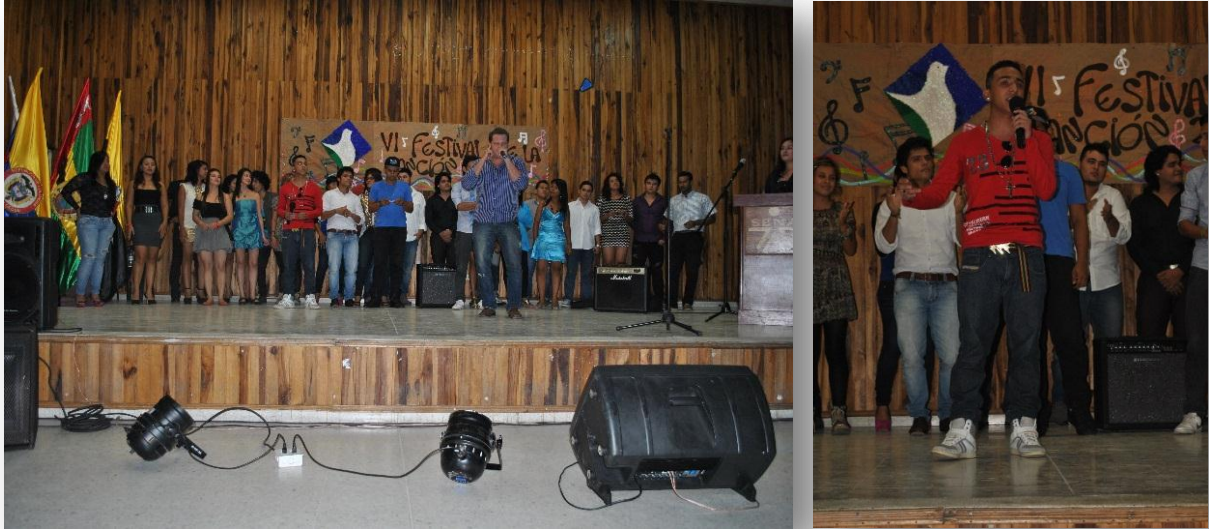
Figura 27. IV Festival de la Canción Unipaz 2013.

- Campaña preservación de bienes. Se realizó la campaña de preservación de bienes de la Institución llevando como lema principal “UNIVERSITARIO INTELIGENTE, CUIDA LA U Y EL MEDIO AMBIENTE”, se contó con el acompañamiento de 6 estudiantes pertenecientes al grupo de teatro disfrazados de mimos y en zancos, quienes mediante un pequeño acto en Biblioteca y cafetería, hicieron un llamado de atención a los estudiantes presentes e hicieron entrega de un volante.