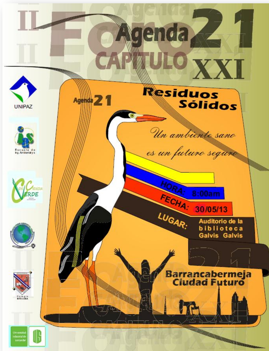
Figura 9. Foro Agenda 21.

Este año cuenta con la articulación organizacional del colegio INTECOBA, La Universidad Industrial de Santander UIS y la Fundación Consultorio Ambiental Conciencia Verde creada en la primera realización de este evento; y el tema central lo enmarca el capítulo XXI de los acuerdos pactados en la Agenda o programa 21 de las Naciones Unidas (ONU).