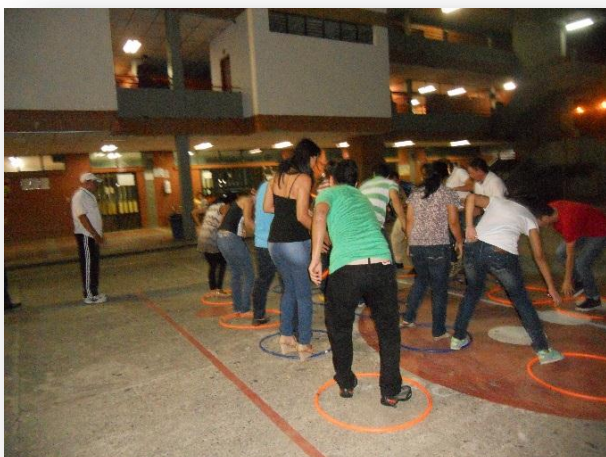
Figura 22. Jornadas lúdico – deportivas en sedes diurna y nocturnas.