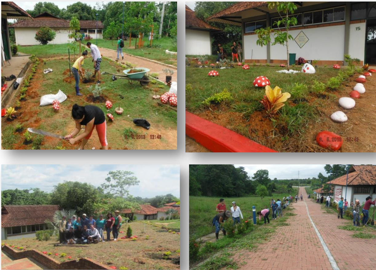
Figura 39. Embellecimiento y ornato del Centro de Investigaciones Santa Lucia.

Con la participación de docentes pertenecientes al grupo de investigación GIAS, el semillero de investigación FOREST y con procesos pedagógicos a través del desarrollo de la catedra de Administración del Paisaje, se realizaron jornadas de adecuación de zonas verdes que permitieron desarrollar las destrezas de los estudiantes y a la vez lograr el mejoramiento del predio de la Institución.