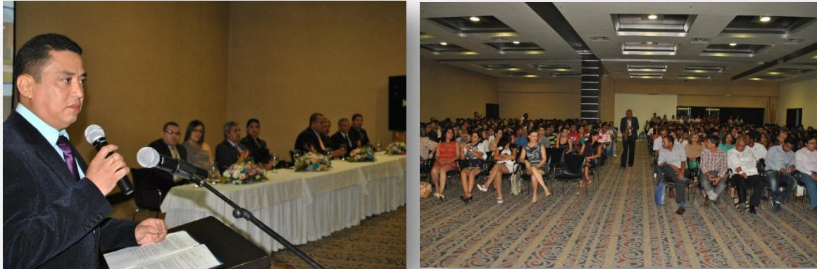
Figura 30. Bienvenida estudiantes de primer semestre.

* Día de la Mujer: Se exaltó la labor de la mujer Docente y Administrativa, mediante presentaciones artísticas y culturas, se hizo entrega de reconocimientos a 4 mujeres de acuerdo a categorías específicas y un detalle como recuerdo de la actividad. Para las estudiantes se hicieron presentaciones musicales, en cada una de las sedes diurna y nocturna y se les hizo entrega de un separador.