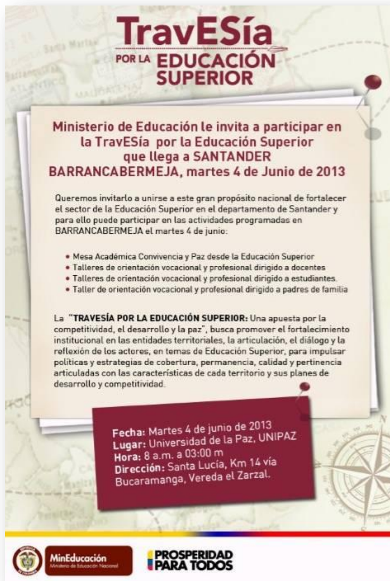
Figura 18. Travesía por la Educación Superior.