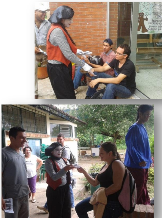
Figura 28. Campaña preservación de bienes.

- Campaña preservación de bienes. Se realizó la campaña de preservación de bienes de la Institución llevando como lema principal “UNIVERSITARIO INTELIGENTE, CUIDA LA U Y EL MEDIO AMBIENTE”, se contó con el acompañamiento de 6 estudiantes pertenecientes al grupo de teatro disfrazados de mimos y en zancos, quienes mediante un pequeño acto en Biblioteca y cafetería, hicieron un llamado de atención a los estudiantes presentes e hicieron entrega de un volante.