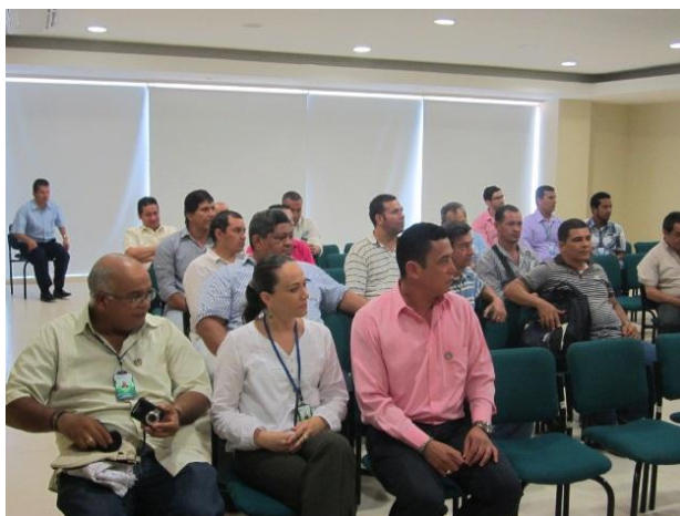
Figura 16. Jornada de promoción institucional.

- Se desarrolló una jornada de promoción institucional ante los docentes y coordinadores del Instituto Técnico Superior Industrial el martes 30 de abril de 2013 en las instalaciones de UNIPAZ. Por lo anterior, se continuará la promoción de los programas de formación UNIPAZ en IEMs de Barrancabermeja (urbanas y rurales, públicas y privadas), de Santander y de la Región del Magdalena Medio. Se encuentran en trámite las primeras reuniones con el rector y funcionarios de los colegios Blanca Duran de Padilla, CASD e INTECOBA para presentar la oferta general de Articulación de UNIPAZ.