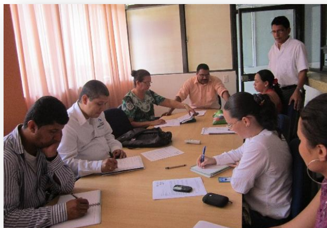
Figura 15. Reuniones con IEM.

- Se desarrolló una jornada de promoción institucional ante los docentes y coordinadores del Instituto Técnico Superior Industrial el martes 30 de abril de 2013 en las instalaciones de UNIPAZ. Por lo anterior, se continuará la promoción de los programas de formación UNIPAZ en IEMs de Barrancabermeja (urbanas y rurales, públicas y privadas), de Santander y de la Región del Magdalena Medio. Se encuentran en trámite las primeras reuniones con el rector y funcionarios de los colegios Blanca Duran de Padilla, CASD e INTECOBA para presentar la oferta general de Articulación de UNIPAZ.