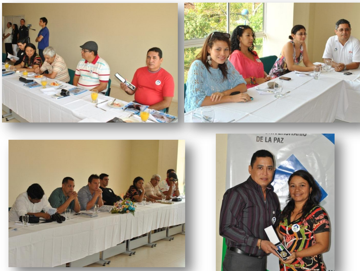
Figura 29. Celebración día del Periodista.

* Celebración día del Periodista. Se realizó un reconocimiento a la Corporación de Periodistas del Magdalena Medio - CORPEMAG y la Asociación de Periodistas de Barrancabermeja - APB, en homenaje al Día del Comunicador Social. Se brindó un desayuno a los asistentes exaltando la labor realizada en los diferentes medios de comunicación.