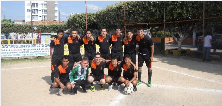
Figura 21. Campeonato interescuelas de futbol.

d. Campeonato interescuelas de futbol. En este campeonato se inscribieron 12 equipos de los diferentes programas académicos, con 113 participantes.