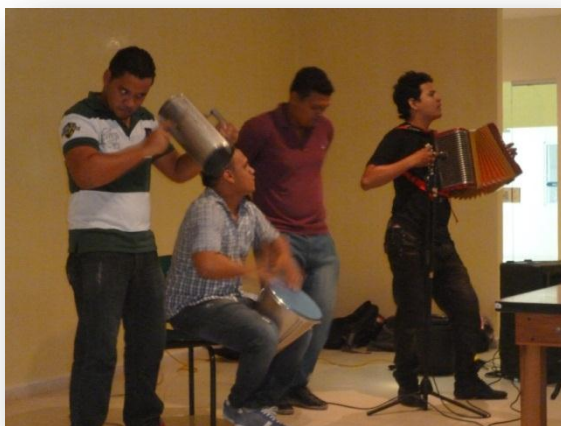
Figura 26. Presentación grupos musicales.