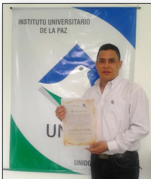
Figura 3. Nodo Santander hace reconocimiento al Instituto Universitario de la Paz.

- Nodo Santander hace reconocimiento al Instituto Universitario de la Paz. El pasado 12 de abril de 2013 la comunidad de aprendizaje Nodo Santander otorgó en el IV encuentro local de semilleros de investigación un reconocimiento al Instituto Universitario de la Paz, por su participación, trayectoria y gestión en la estrategia de semilleros de investigación a nivel Local, Departamental y Nacional.