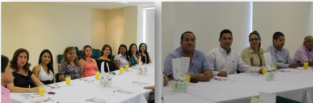
Figura 32. Día de la Secretaria.

* Día de la Secretaria. Se rindió homenaje a las secretarias en su día, ofreciendo un almuerzo a los asistentes, acompañado de Amenización musical, lectura de un poema y entrega de un detalle de recuerdo. Asistieron: Rector, Vicerrector, Directores de escuela, Jefes de Dependencias y secretarias.