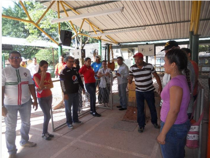
Figura 24. Campeonato de minitejo Docentes y Administrativos

h. Campeonato de rana y dominó. Para el campeonato de rana se inscribieron 6 jugadores y en dominó se inscribieron 8 parejas entre docentes y personal administrativo.