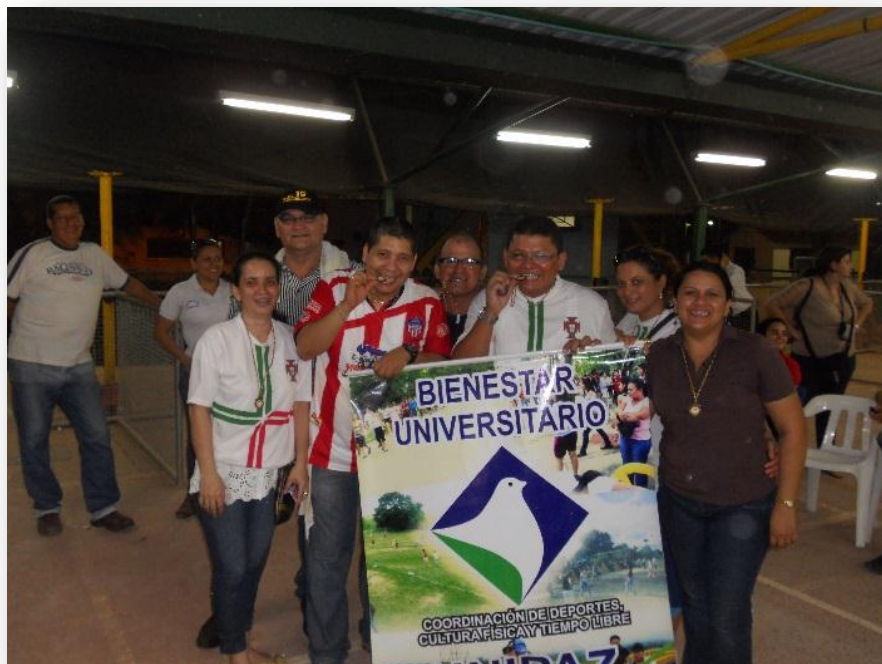
Figura 25. Campeonato de rana y dominó.

h. Campeonato de rana y dominó. Para el campeonato de rana se inscribieron 6 jugadores y en dominó se inscribieron 8 parejas entre docentes y personal administrativo.