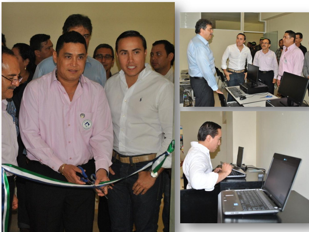
Figura 37. Inauguración de Aulas Virtuales.

1.4.4 Organización de la Biblioteca de UNIPAZ. Con la remodelación del edificio llevada a cabo en los primeros meses del año, se logró una mejor fachada y unos espacios internos acordes a los mejores estándares de calidad en infraestructura física y prestación de servicio; logrando