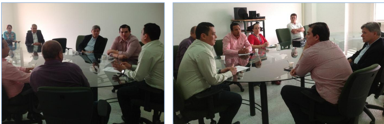
Figura 2. Visita en UNIPAZ del Exrector de la Universidad Nacional de Lomas de Zamora Buenos Aires (Argentina)

- Nodo Santander hace reconocimiento al Instituto Universitario de la Paz. El pasado 12 de abril de 2013 la comunidad de aprendizaje Nodo Santander otorgó en el IV encuentro local de semilleros de investigación un reconocimiento al Instituto Universitario de la Paz, por su participación, trayectoria y gestión en la estrategia de semilleros de investigación a nivel Local, Departamental y Nacional.