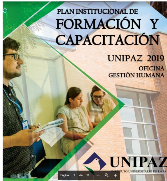
Plan Institucional de capacitaciones vigencia 2019

Decreto Ordenanza 0331 de 1987 Gobernación de Santander Vigilada Mineducación NIT 800.024.581-3