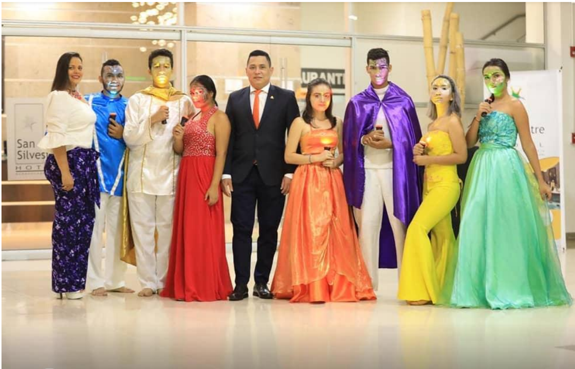
Semana de Valores Institucionales UNIPAZ

La Institución vela constantemente por la socialización de los valores a través de campañas que integran a toda la comunidad universitaria, para ello promovió la vivencia de los valores institucionales durante la semana del 28 de octubre al 3 de noviembre de 2019 en el marco del proyecto Orgullosamente UNIPAZ .