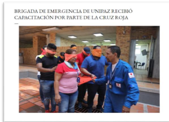
Entrenamiento Brigada de emergencia

Prevención De Accidentes De Trabajo. Se realizó la campaña de prevención de accidentes de trabajo de caída a nivel con el fin de concientizar a la comunidad académica en prevención de lesiones.