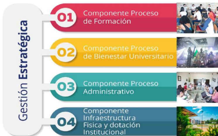
Estructura Plan de Desarrollo Institucional de UNIPAZ 2012-2021

Decreto Ordenanza 0331 de 1987 Gobernación de Santander Vigilada Mineducación NIT 800.024.581-3