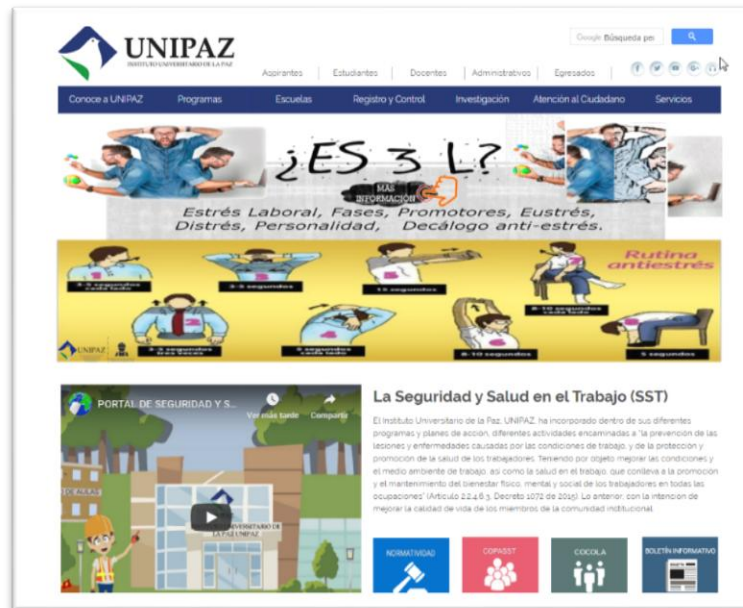
Portal de Seguridad y salud en el Trabajo- Página web UNIPAZ

El Instituto Universitario de la Paz adopto la Política de Seguridad y Salud en el Trabajo mediante Resolución REC-0148-19 del 4 de marzo de 2019.