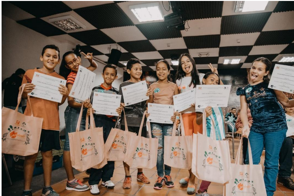
Figura 6. Informe Red de Colegios Sostenibles