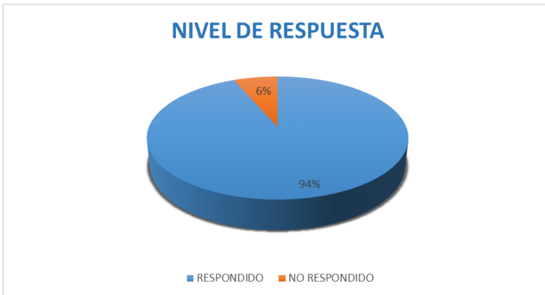
Figura 13. Nivel de Respuesta a las PQRSF.

encuentran dentro de dichos términos y corresponden a Derechos de Petición que requieren de información complementaria especializada y anexos relacionados con peticiones específicas. Este comportamiento indica que la capacidad de respuesta institucional se ha fortalecido debido al posicionamiento de los mecanismos establecidos para garantizar la satisfacción de los usuarios, clientes y partes interesadas a los cuales se les presta el servicio.