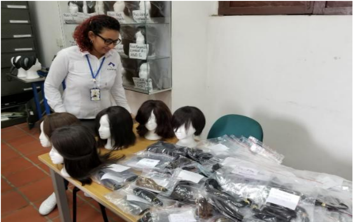
Figura 7. Campaña “El cabello es lo de más”.

Decreto Ordenanza 0331 de 1987 Gobernación de Santander Vigilada Mineducación NIT 800.024.581-3