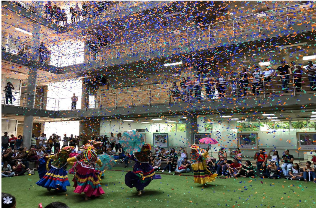
Figura 2. Conmemoración del Día Internacional de La Mujer UNIPAZ

Decreto Ordenanza 0331 de 1987 Gobernación de Santander Vigilada Mineducación NIT 800.024.581-3