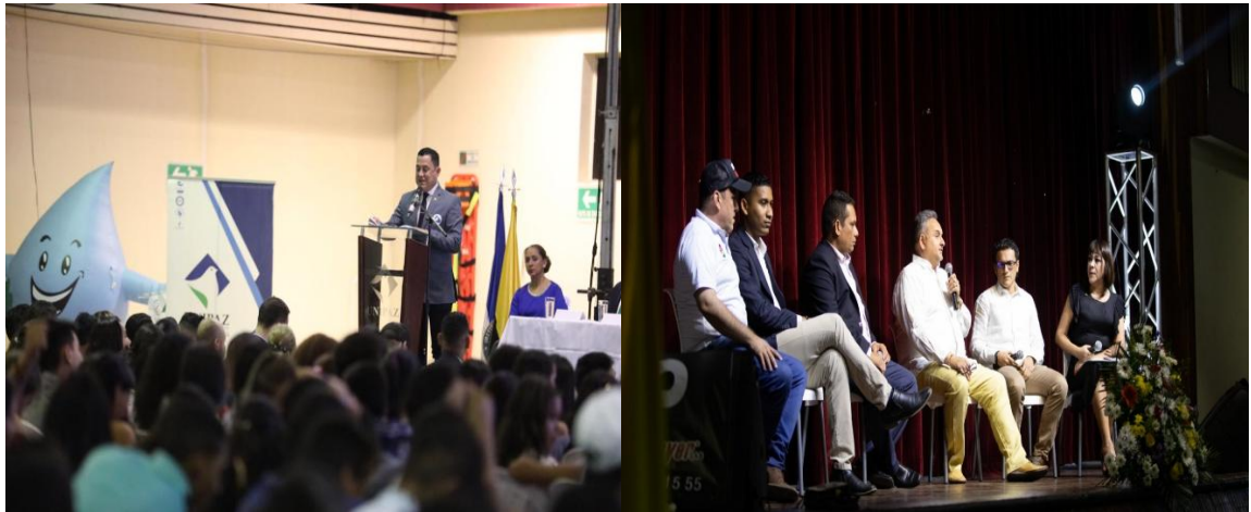
Figura 3. Jornada de Inducción 2019.

Los profesionales UNIPAZ invitados al evento, coincidieron en el mensaje entregado a los nuevos estudiantes, expresándoles la importancia de aprovechar la oportunidad de educación que han tenido y perseverar para llegar hasta el final en el camino de la realización del sueño de ser profesionales, sin importar los obstáculos que este sendero les pueda presentar.