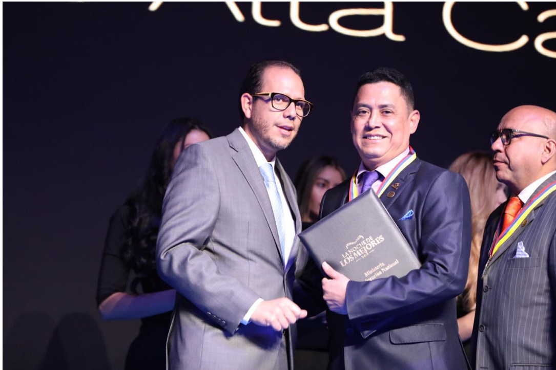
Figura 9. UNIPAZ en la Noche de Los Mejores 2018.

Decreto Ordenanza 0331 de 1987 Gobernación de Santander Vigilada Mineducación NIT 800.024.581-3