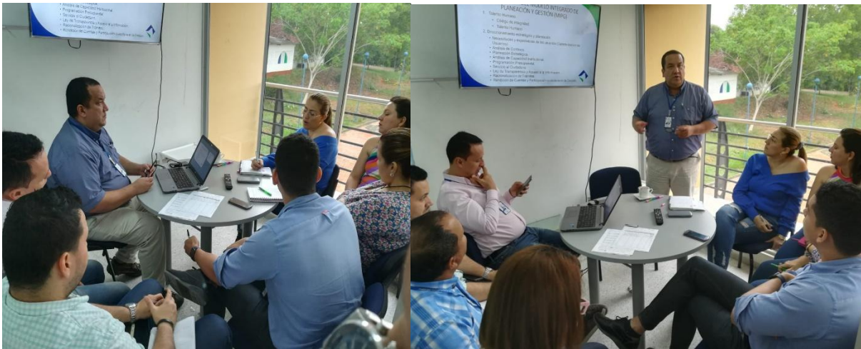
Figura 8. Capacitación MIPG.

Con el fin de dar cumplimiento a esta premisa, la oficina de Evaluación y Control de Gestión realizó una capacitación sobre el proceso de implementación del MIPG, incluyendo la distribución de tareas y responsables de adelantar los respectivos autodiagnósticos para cada uno de los componentes que integran el modelo y de esta manera proceder posteriormente a la implementación de los planes de mejoramiento resultantes.