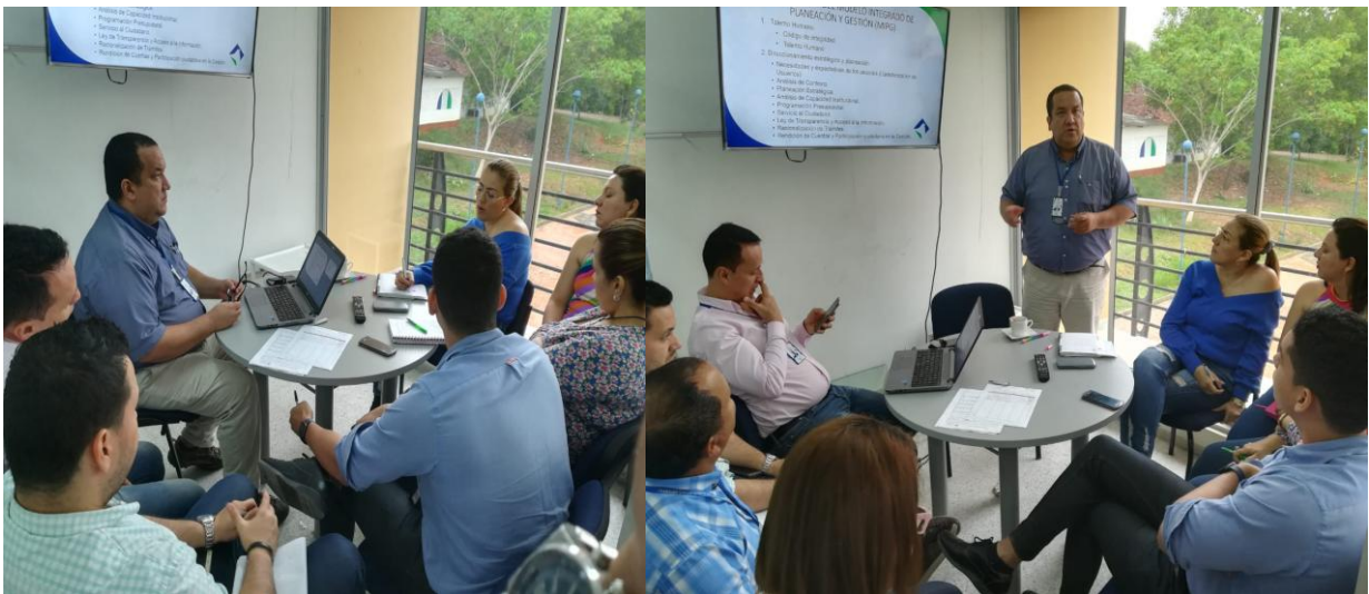
Figura 14. Capacitación sobre actualización de MIPG.

Para adelantar la implementación del Modelo Integrado de Planeación y Gestión (MIPG), según lo establecido en el Decreto 1499 de 2017 y Decreto 648 de 2017, la institución definió el Comité Institucional de Gestión y Desempeño, el acto administrativo correspondiente. La oficina de Evaluación y Control de Gestión brindó una capacitación sobre la importancia de implementar las diferentes políticas que contiene MIPG en sus distintos componentes. Se inició el proceso de diligenciamiento del autodiagnóstico establecido por MIPG en sus componentes constituyentes designando los respectivos responsables.