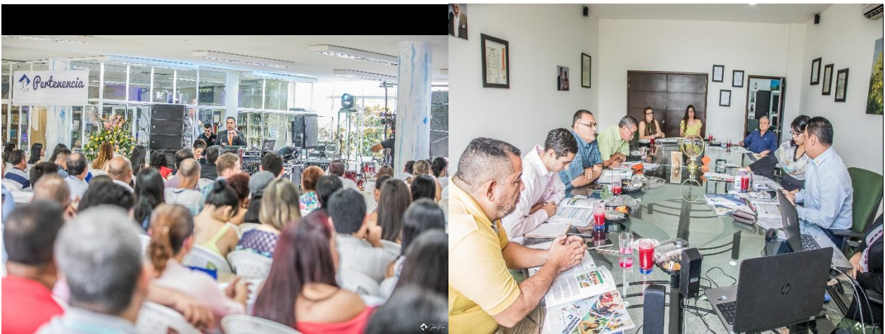
Figura 10. Rendición de Cuentas ante el Consejo Directivo y Comunidad Académica.