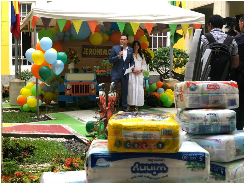
Figura 5. Jornada DONATÓN de pañales