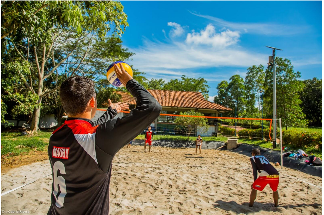
Figura 1. Campeonato de Voley Playa

Decreto Ordenanza 0331 de 1987 Gobernación de Santander Vigilada Mineducación NIT 800.024.581-3