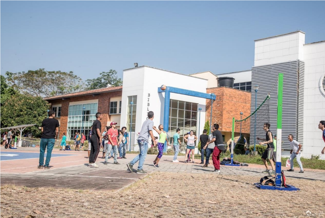
Figura 4. Jornada de RECREARTE.

Decreto Ordenanza 0331 de 1987 Gobernación de Santander Vigilada Mineducación NIT 800.024.581-3