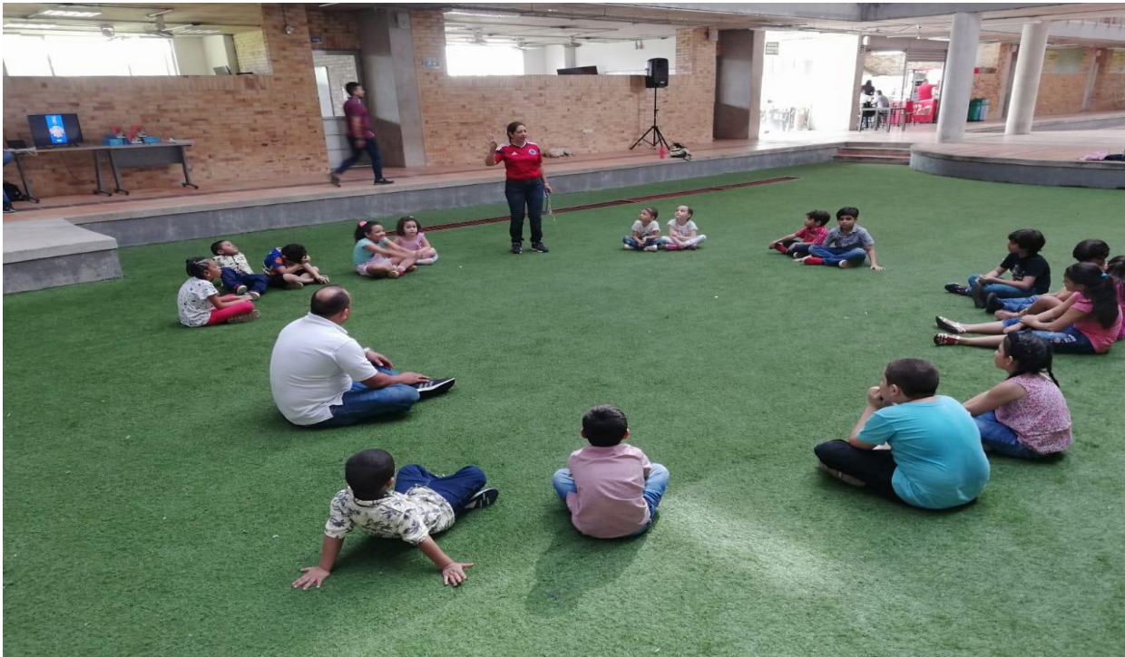
Figura 5. Jornada de vacaciones recreativas para los hijos de los docentes y funcionarios.

Decreto Ordenanza 0331 de 1987 Gobernación de Santander Vigilada Mineducación NIT 800.024.581-3