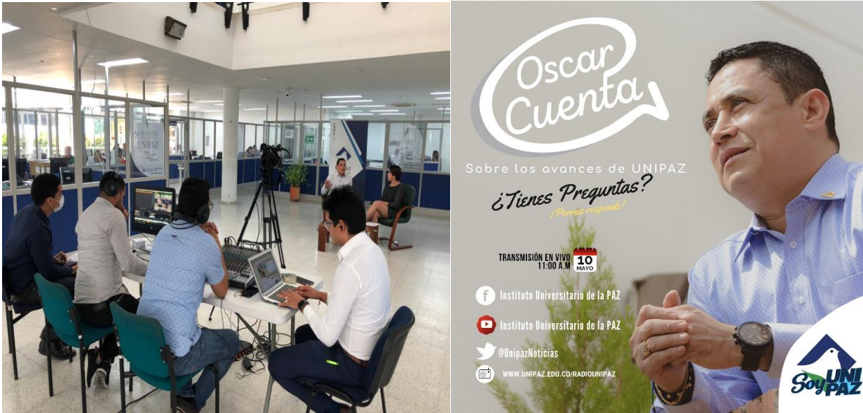
Figura 12. Programa “Oscar cuenta”, para rendición de cuentas ante la comunidad académica.

Decreto Ordenanza 0331 de 1987 Gobernación de Santander Vigilada Mineducación NIT 800.024.581-3