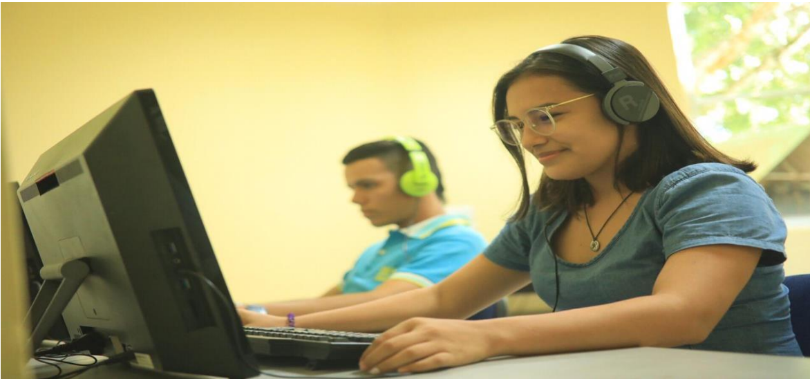
Figura 6. Nuevas salas de cine, música y sala de lectura en la biblioteca de UNIPAZ.

Sala de Música: Sala especializada para escuchar música en un ambiente relajado y personalizado por ciclos o por temáticas especiales de acuerdo con su programación o mediante el uso de dispositivos para escucha individual (audífonos). Puede ser utilizada de manera individual, grupal o como herramienta complementaria del ejercicio académico. Capacidad máxima 7 personas.