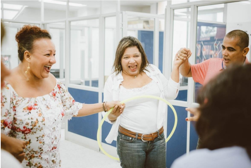
Figura 3. II Jornada de promoción de la salud y prevención de enfermedades laborales.