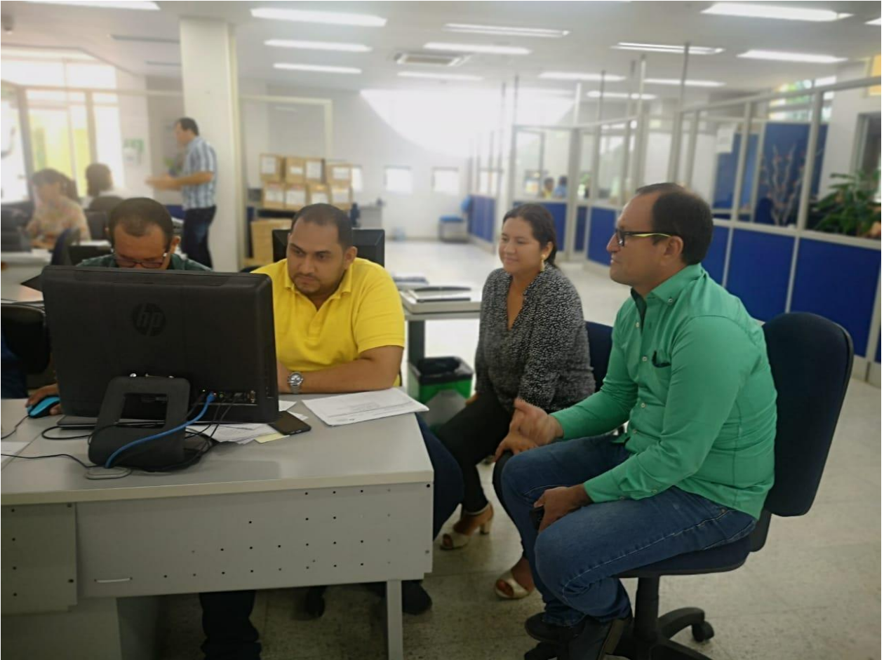
Figura 10. Auditorias interna de calidad, ciclo 2019.

Decreto Ordenanza 0331 de 1987 Gobernación de Santander Vigilada Mineducación NIT 800.024.581-3