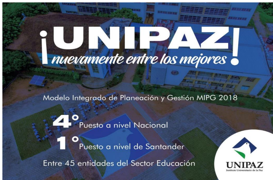
Figura 14. UNIPAZ, nuevamente entre los mejores en la implementación de MIPG.

Nuestra institución nuevamente se ubicó entre los primeros lugares, ocupando el Cuarto puesto en el Grupo Par conformado por 45 entidades del Sector Educación, obteniendo un índice de desempeño institucional a nivel nacional de 73.2 y la primera a nivel del Departamento de Santander.