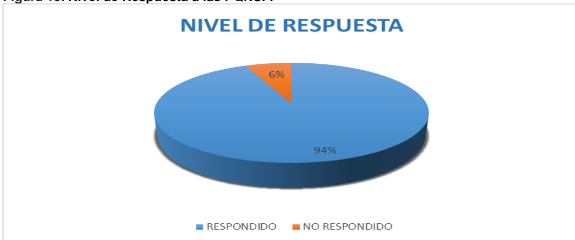
Figura 13. Nivel de Respuesta a las PQRSF.

Durante el semestre A de 2019, se puede apreciar que la mayoría de las solicitudes se respondieron dentro de los términos de ley (94%). De las 87 solicitudes presentadas, el 94% recibieron respuesta oportuna y dentro de los términos de ley, es decir, luego de 10 días hábiles en concordancia con el artículo 22 del Código Contencioso Administrativo. Los restantes se encuentran dentro de dichos términos y corresponden a Derechos de Petición que requieren de información complementaria especializada y anexos relacionados con peticiones específicas. Este comportamiento indica que la capacidad de respuesta institucional se ha fortalecido debido al posicionamiento de los mecanismos establecidos para garantizar la satisfacción de los usuarios, clientes y partes interesadas a los cuales se les presta el servicio.