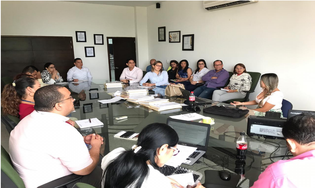
Figura 9. Auditorías Externa, realizada por la Contraloría Departamental.

economía, la eficacia, la equidad, y la valoración de los costos ambientales sobre el manejo de los recursos de la institución, correspondientes a la vigencia 2018.