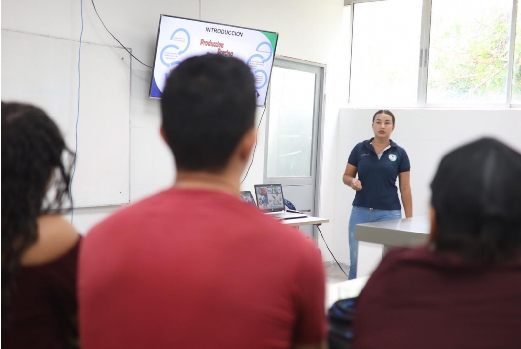
Figura 1. Encuentro Institucional de Semilleros.

El Encuentro Institucional de Semilleros de Investigación 2019-A que se llevó a cabo desde durante los días 27 y 28 de marzo del año en curso, en el Centro de Investigaciones Santa Lucía, a partir de las 8:00 a.m.