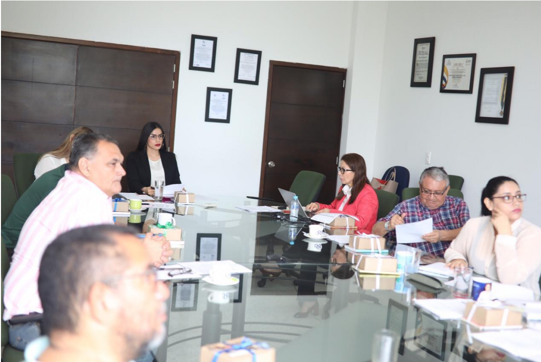
Figura 8. Rendición de Cuentas ante el Consejo Directivo.