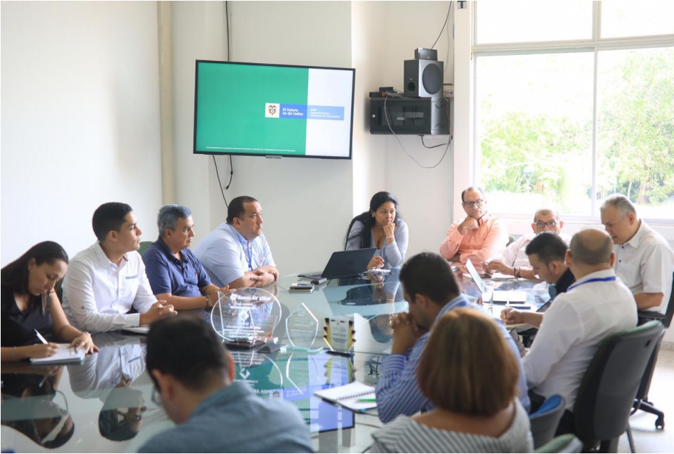
Figura 11. Visita de verificación por parte del Departamento Nacional de Planeación (DNP).

La visita realizada se cumple en la orientación del gobierno nacional de fortalecer la transparencia, la participación ciudadana y el buen gobierno que le corresponde al Sistema de Monitoreo, Seguimiento y Control; y Evaluación administrativa.