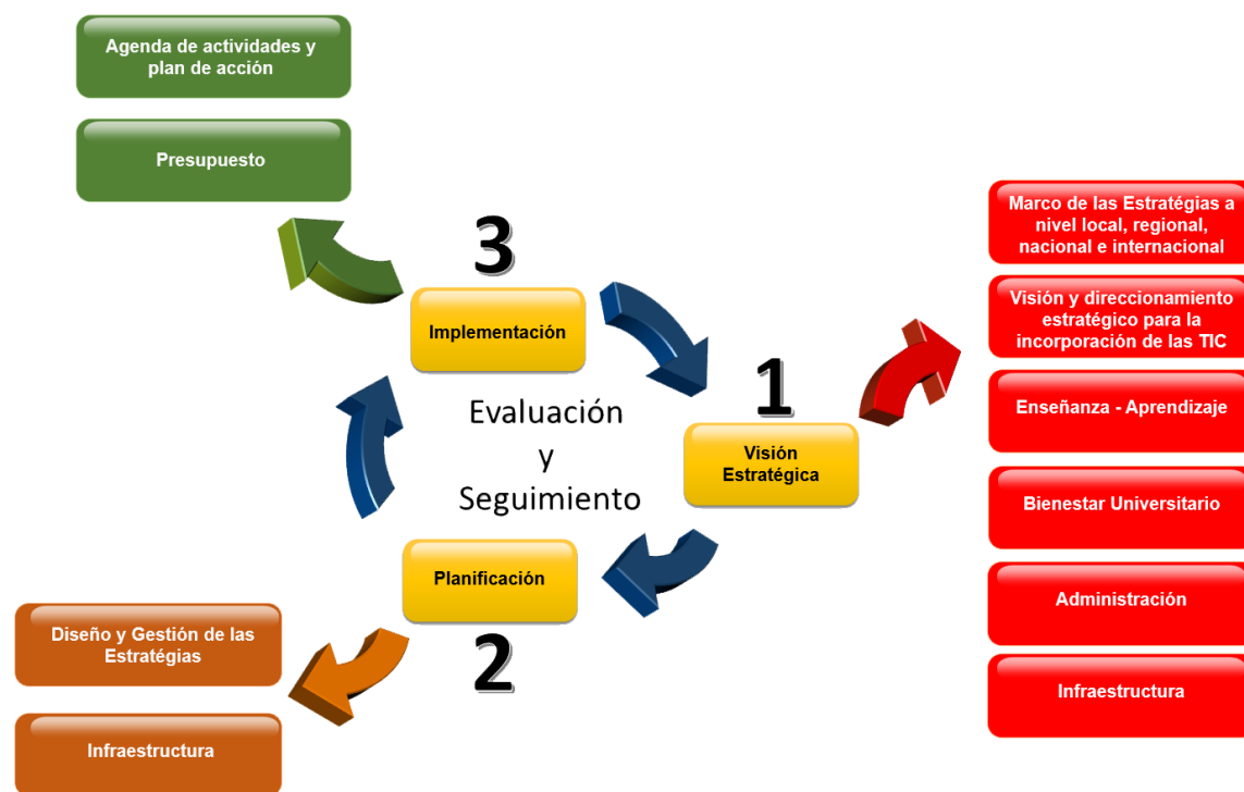
Figura 1. Proceso de incorporación de TIC para UNIPAZ

El proceso de incorporación y uso de TIC en UNIPAZ estará definido en esta política de TIC, y tendrá como proceso de desarrollo la metodología plasmada en la siguiente figura: