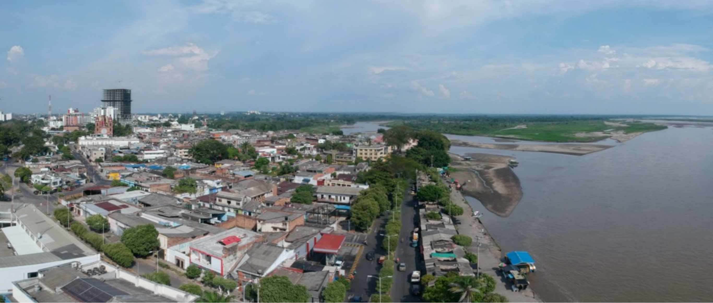
Panorámicas del contexto social de Distrito Especial de Barranquilla.

Un trabajo con las comunidades del puerto petrolero, donde con escasos recursos se logran interesantes propuestas de creación.