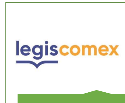
Adquisición de Software