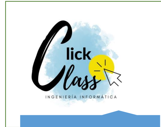
Programación Click Class Ingeniería Informática