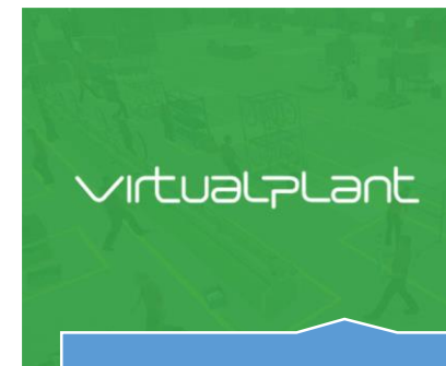
Plataforma de logística