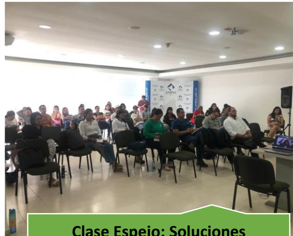
Clase Espejo: Soluciones Tecnológicas en Compras (Invitada Internacional Argentina)