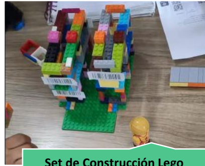
Set de Construcción Lego Administración de Negocios Internacionales