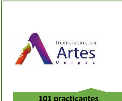
101 practicantes 37 instituciones Licenciatura en Artes