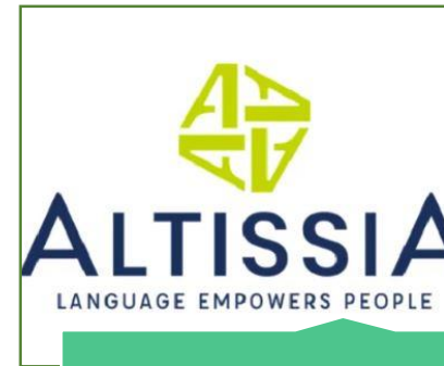
Software de idiomas