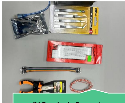
IV Rueda de Proyectos Ingeniería Informática