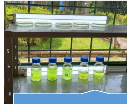
Proyecto Microalgas Químipaz