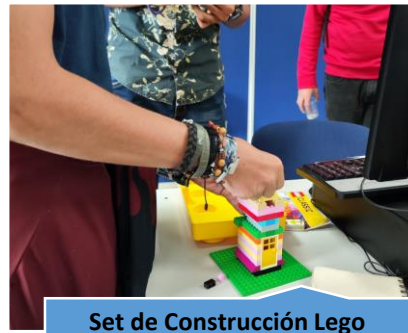
Set de Construcción Lego Ingeniería Informática