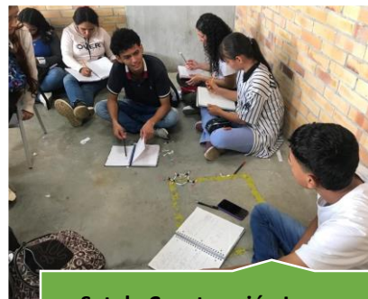
Set de Construcción Lego Química