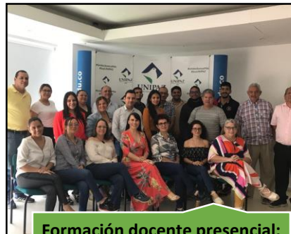
Formación docente presencial: Estrategias docentes para un aprendizaje significativo