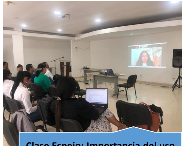
Clase Espejo: Importancia del uso del Software SAP en las empresas (Invitada Internacional México)