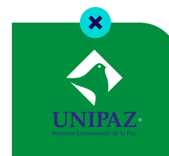
Logo en un color que no hace parte de la paleta