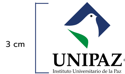
Tamaño mínimo Folleto