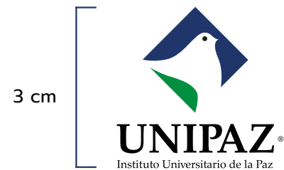
Tamaño mínimo Media página