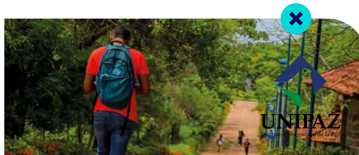
Logo sobre foto sin franja blanca