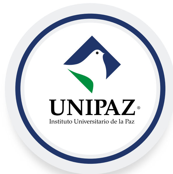
Imagen de perfil